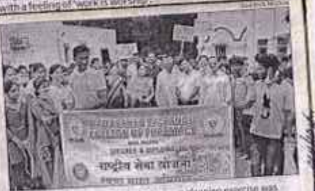
As part of the National Service Scheme, a cleaning exercise was taken up by Dadasaheb Balpant College of Pharmacy, Besa, at Indira Gandhi Government Medical College and Hospital, on Sunday