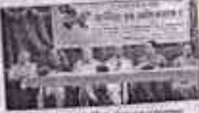
Signatories at the programme 'Kashmir: Fear and reality' at Chanvate Hall, on Saturday